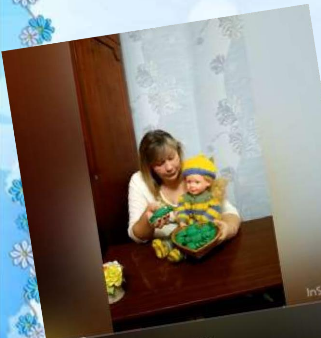
«Цукерки для ляльки»