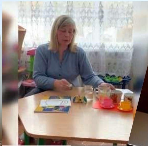
Вільне малювання «Чашечка»