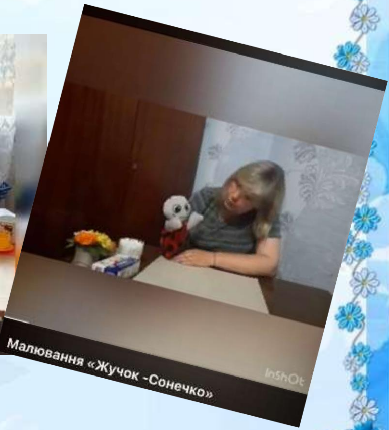
Малювання «Жучок - Сонечко»